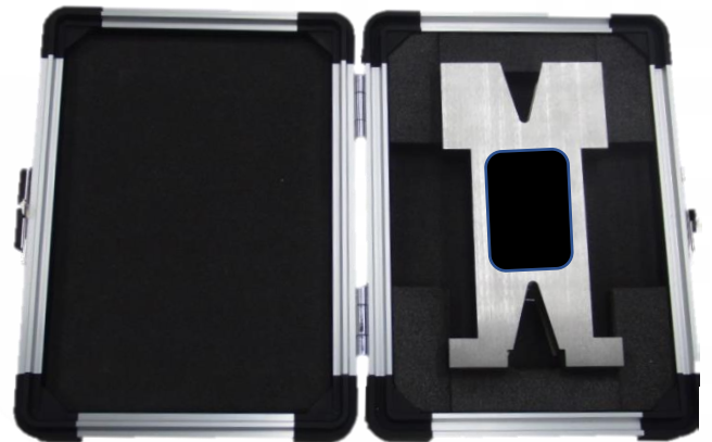
ケース入り実物写真